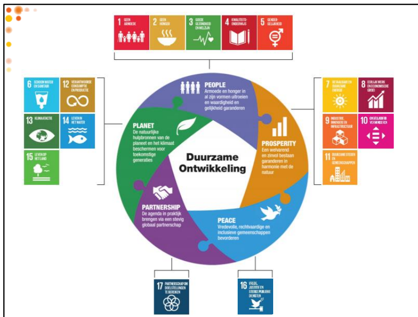
Onderverdeling van de SDG's over de 5 pijlers